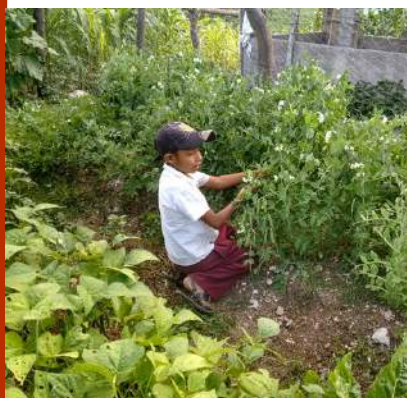
Niño cosechando en su casa (Tabernillas)