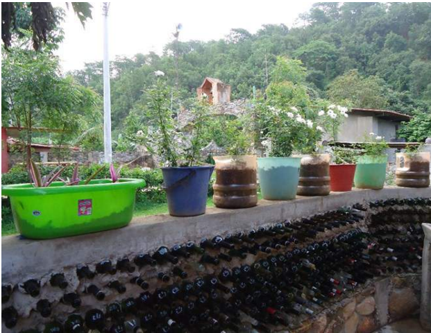
Mtra. Florentina Zeferino Cruz

Realizando diferentes actividades con los alumnos reusando los utensilios rotos de macetero para las plantas, reproduciendo fresas con los niños de diferentes edades y plantando las rosas con las niñas para dar una mejor vista de nuestra comunidad.