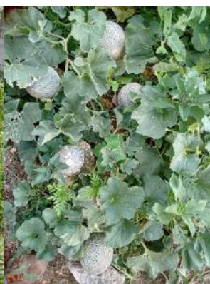
Producción de melones (Tabernillas)