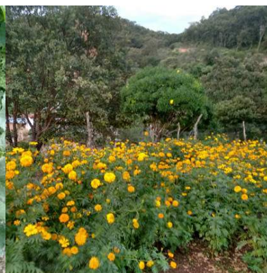
Cosecha floreciendo (Tabernillas)

Dentro de la asistencia técnica se les comparten una serie de recomendaciones para mejorar sus productos. Se visitan las parcelas en campo, para realizar algunas recomendaciones en el manejo del cultivo de frijol y maíz, las lluvias son escasas y eso implica un reto mayor para la producción alimentaria. El frijol ejotero es una de las hortalizas del gusto de las personas, se adapta muy bien al clima y se vende muy bien.