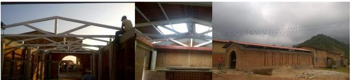
Avances de Iglesia en Llano de la Parota