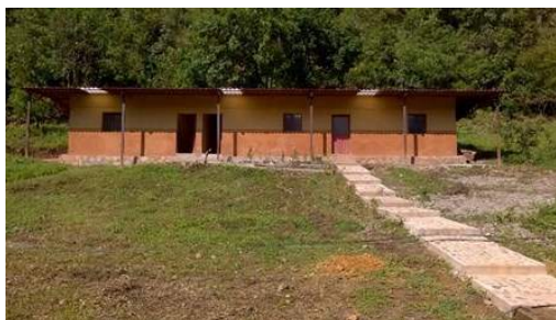
Escuela Comunitaria en Plan de San Marcos