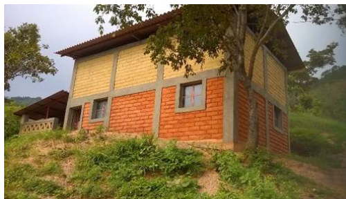
Viviendas terminadas en Río Grande