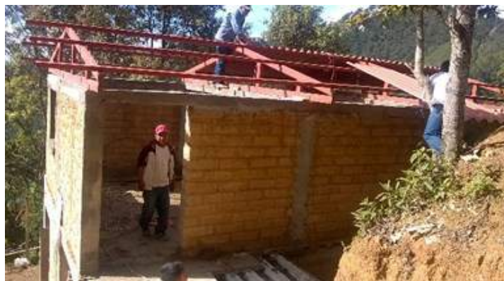
Avances en Taller de Artesanas en Col. Sta. Cruz