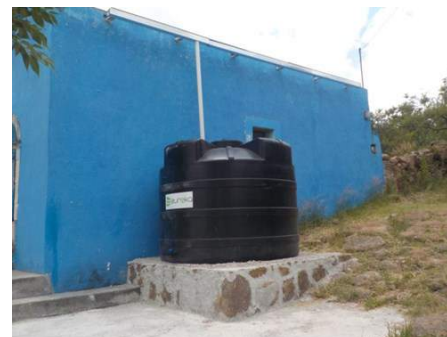
Cisterna habilitad por Unidos por la Montaña