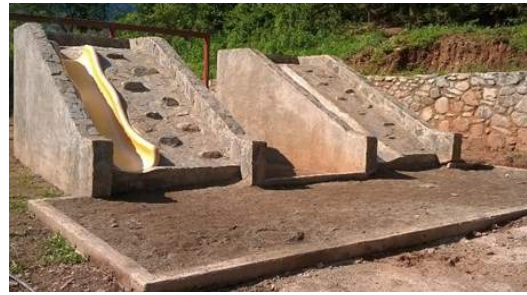
Área de Juegos Infantiles en Plan de San Marcos